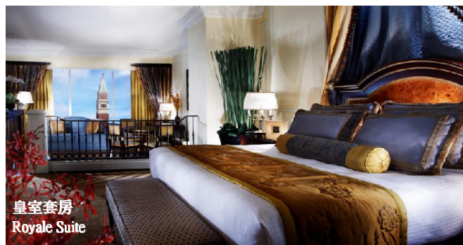
皇室套房 Royale Suite

*賓客如乘坐由香港出發之金光飛航抵達澳門威尼斯人，即可免費獲贈回程船票兩張。換取回程船票時，請出示由香港至澳門之金光飛航付費船票票根。票根必須與登記入住酒店之日期相符。所獲贈之回程船票（澳門至香港）只適用於退房離開酒店當天，而每間套房最多只可換取兩張指定免費船票。