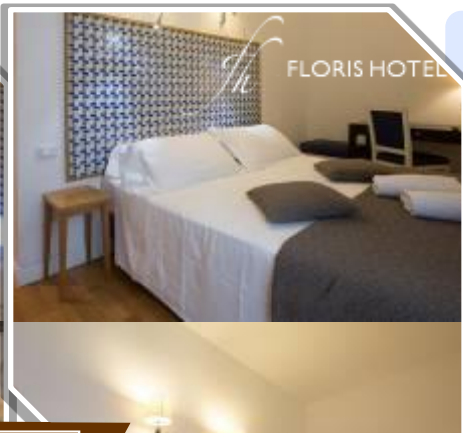
鄰近羅馬聖保羅教堂及歌劇院