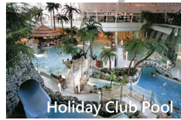
Holiday Club Pool