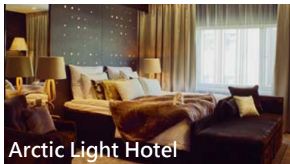
Arctic Light Hotel