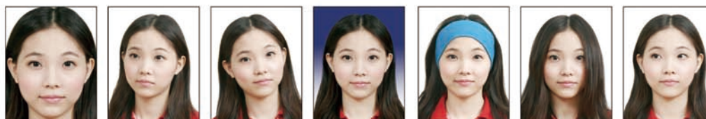
頭髮碰觸到 照片邊框