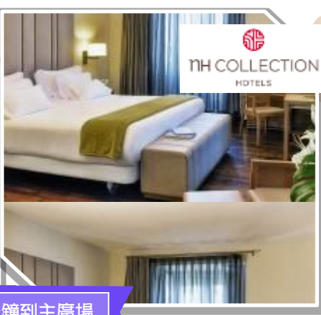
位於歷史文化區 · 步行10分鐘到主廣場