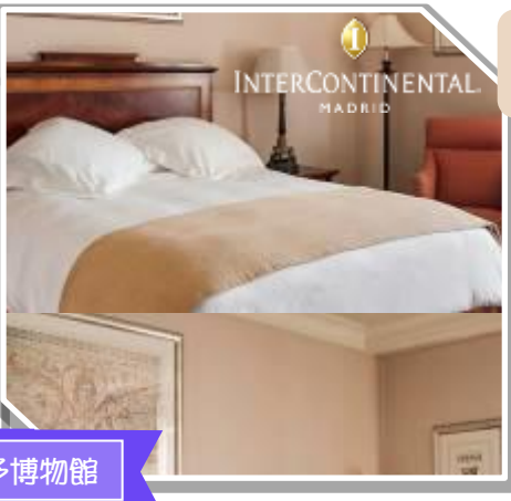
古典高雅酒店 · 鄰近普拉多博物館