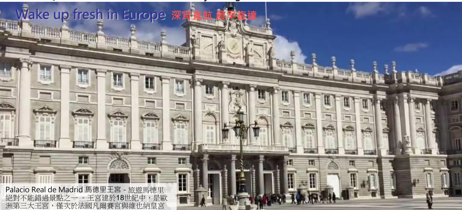
Palacio Real de Madrid 馬德里王宮 - 旅遊馬德里絕對不能錯過景點之一。王宮建於18世紀中，是歐洲第三大王宮，僅次於法國凡爾賽宮與維也納皇宮