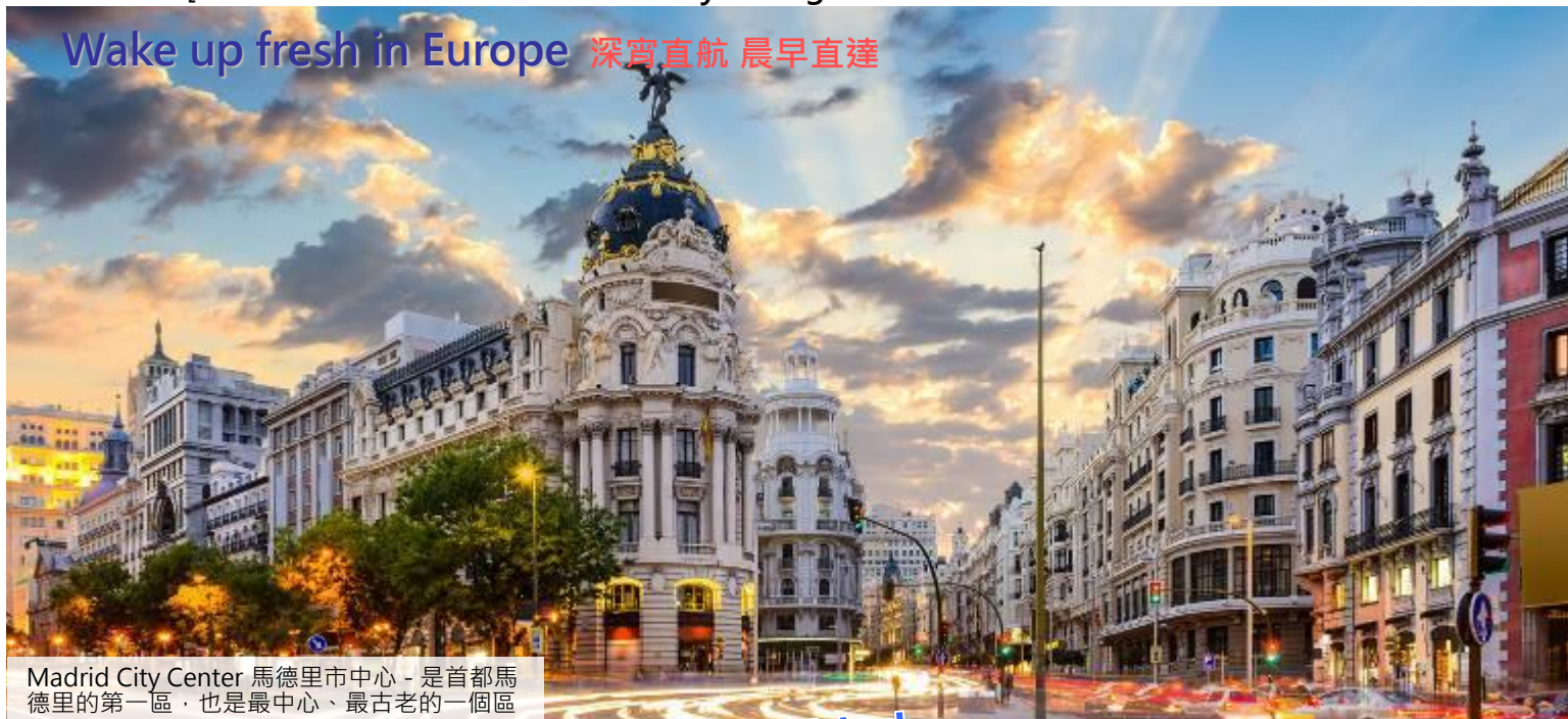
Madrid City Center 馬德里市中心 - 是首都馬德里的第一區, 也是最中心、最古老的一個區