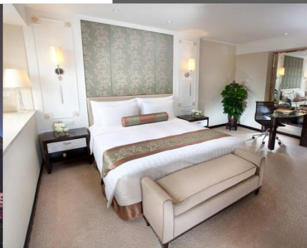
帝盛客房 Dorsett Room (市景) 大床x1/單人床x2 | 約291-344平方呎 | 最多3人